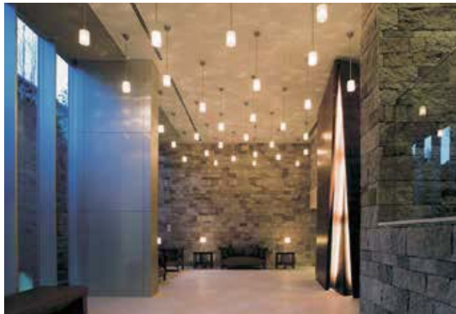
ディアナコート上原