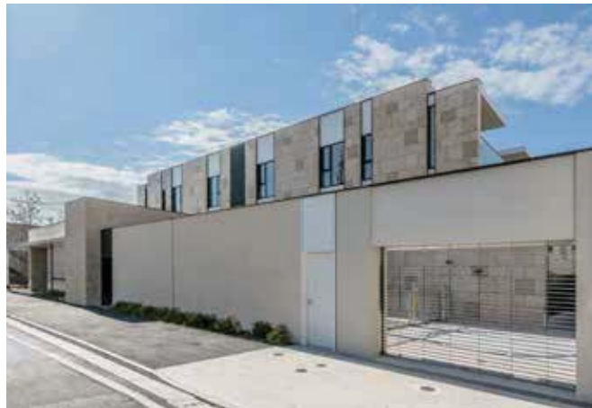
ディアナコート浜田山

「モリモトクオリティ」という、不動産関連企業4社による総合不動産グループを形成するに至りました。