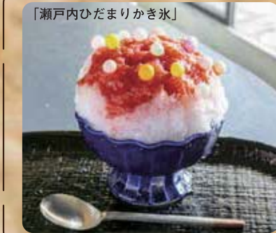
「瀬戸内ひだまりかき氷」

※おすすめ時間帯について。2018年5月時点での、比較のお店が空いている時間帯をご紹介します。